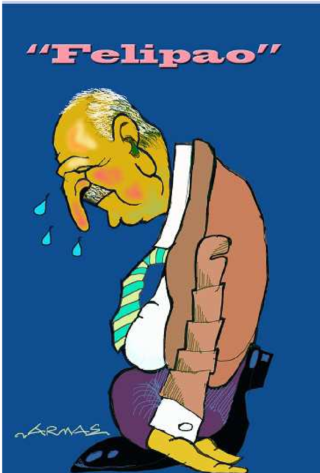
Luiz Felipe Scolari (1948)

Reducido a su mínima expresión al ser vapuleado por la crítica especializada, los comentaristas de su país y la crítica en general, el ex-entrenador de la Selección Brasileña se retiró sin rumbo fijo y sin equipo, envuelto en una nube de vergüenza deportiva por la pésima actuación de su equipo en el último Mundial de Fútbol.